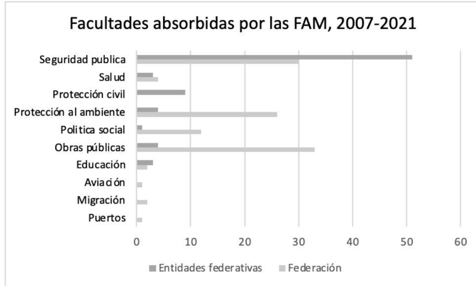
Gráfica 1. Facultades o funciones absorbidas por las FAM

* Un convenio puede involucrar más de una facultad, por ejemplo: política social y medio ambiente.